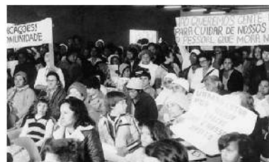
Manifestação da luta por creches, 81