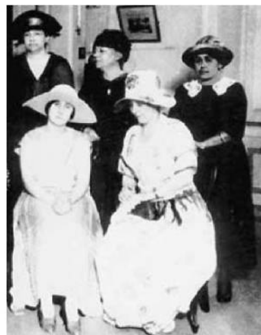
Mulheres pelo Progresso Feminino, década de 20

Consideradas como a causa e objeto do pecado, com exceção das virgens e casadas.